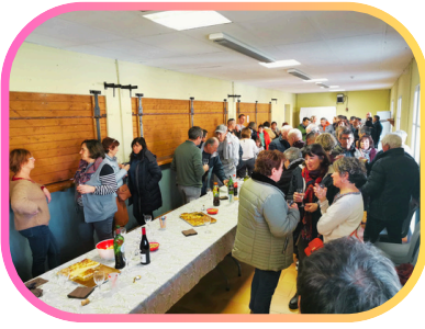
La cérémonie des vœux 2024