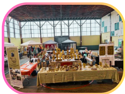
Le salon du bien-être