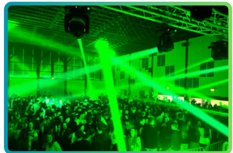
Le bal du comité des fêtes