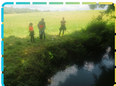
La fête de la pêche