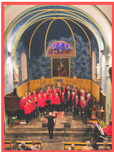
Le concert des Voix D'Alaric à l'église