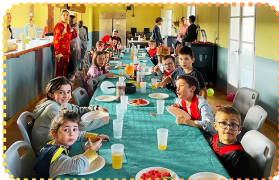
Le carnaval des enfants