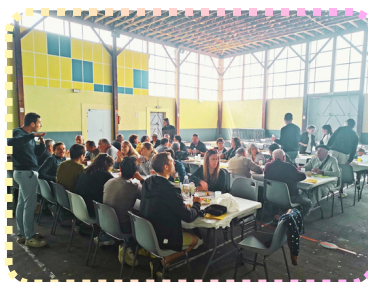
Le repas du village