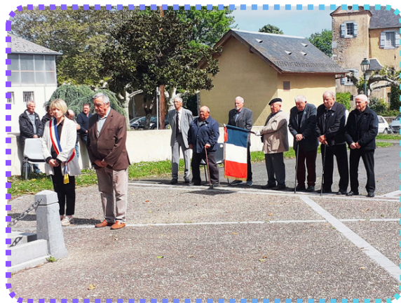
La cérémonie du 8 mai