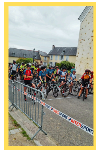
Le championnat départemental UFOLEP de cyclisme sur route