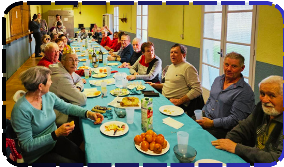
Le goûter des aînés