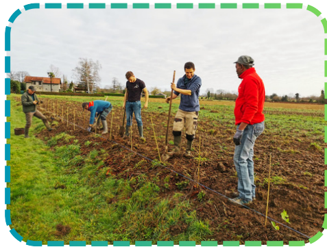
Les plantations des haies